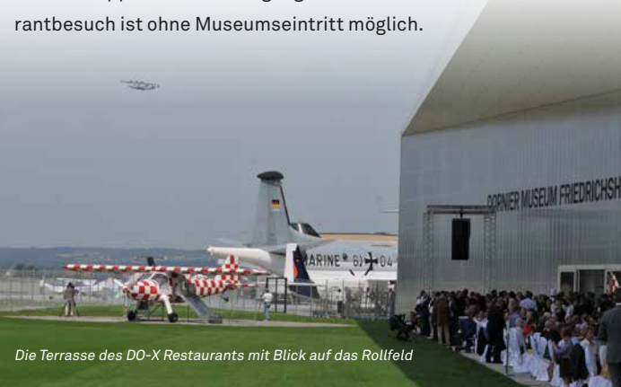
Die Terrasse des DO-X Restaurants mit Blick auf das Rollfeld

Genießen Sie die regionale Küche und einmalige Atmosphäre des DO-X Restaurants beim Mittagstisch, bei Kaffee und Kuchen oder einem Snack. Lassen Sie Gesehenes und Erlebtes auf sich wirken und genießen Sie den einmaligen Blick von der großen Terrasse auf das Rollfeld des Flughafens sowie den startenden und landenden Zeppelin NT – ein Highlight am Bodensee. Der Restaurantbesuch ist ohne Museumseintritt möglich.