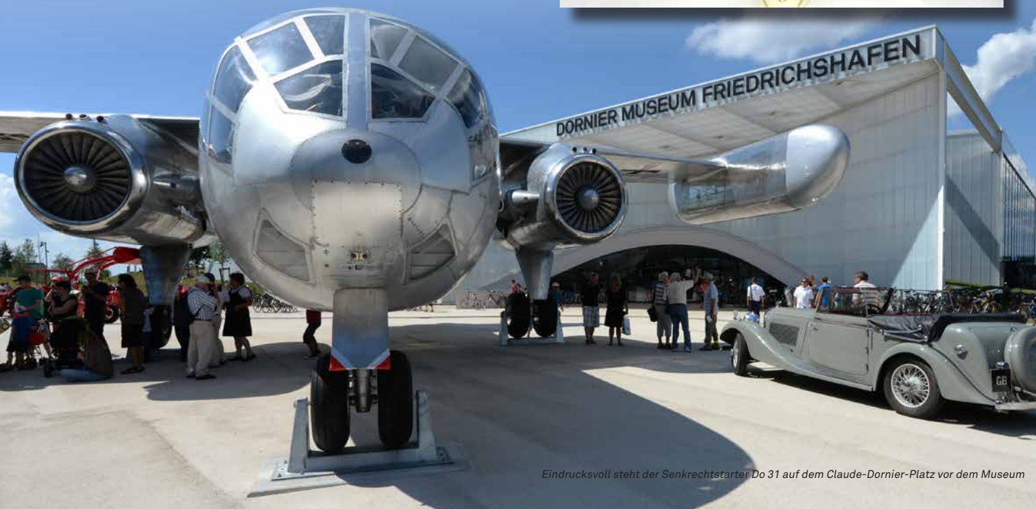
Eindrucksvoll steht der Senkrechtstarter Do 31 auf dem Claude-Dornier-Platz vor dem Museum